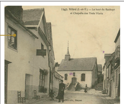
La chapelle des Trois-Marie, carte postale, Archives de Vitré Communauté, Fonds Karkégi, 29 Z37.

Construite sur un éperon rocheux, la chapelle s’élève en haut de la rue du Rachapt. Son histoire remonterait au Moyen-âge tardif, selon les écrits de l’abbé Bouquay. Elle fut restaurée à plusieurs reprises. Aujourd’hui, elle s’inscrit comme l’un des édifices majeurs de ce quartier.