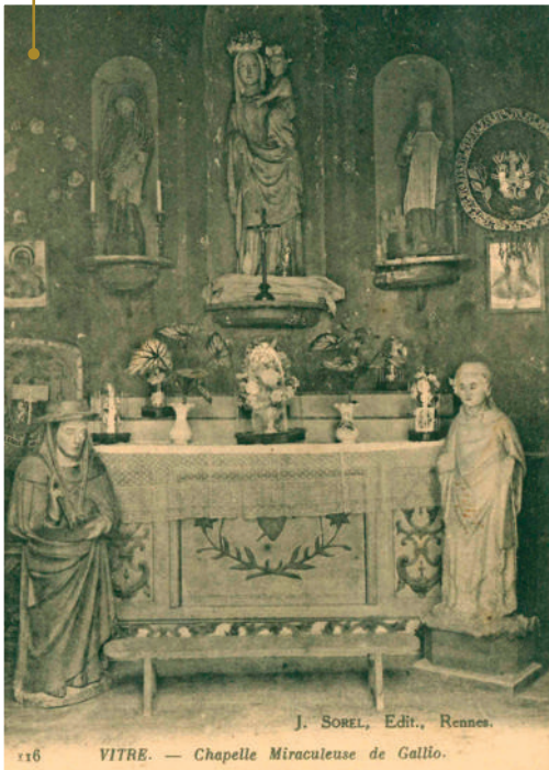
La Chapelle Galiot, carte postale

Il s’agit de la chapelle du cimetière de l’hôpital. La date de « 1754 » apparaît sur l’édifice. Le Pouillé historique indique la présence de statues de pierre (aujourd’hui disparues) : la Vierge-Marie, Sainte-Marguerite, Saint-Yves, Saint-Nicolas, Saint-Roch, Sainte-Anne. Dans ce cimetière, est inhumé l’Abbé Cousin, ancien aumônier des hospices de Vitré (1798) 2 .