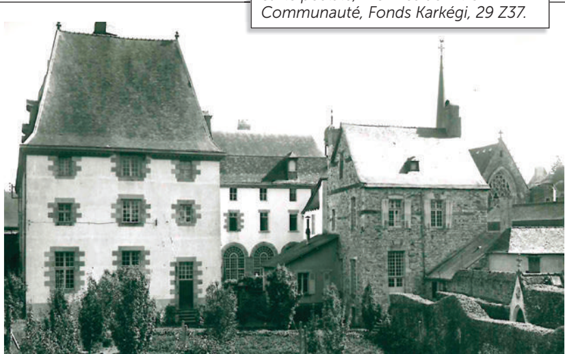
Le Rachapt, monastère Saint-Nicolas, Photographie, Archives de Vitré Communauté, Fonds Y. Gautier, 57 Fi.