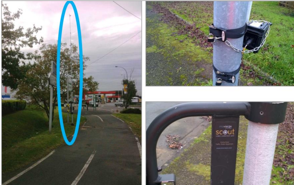
Exemple de mât de comptage et de son système de fixation