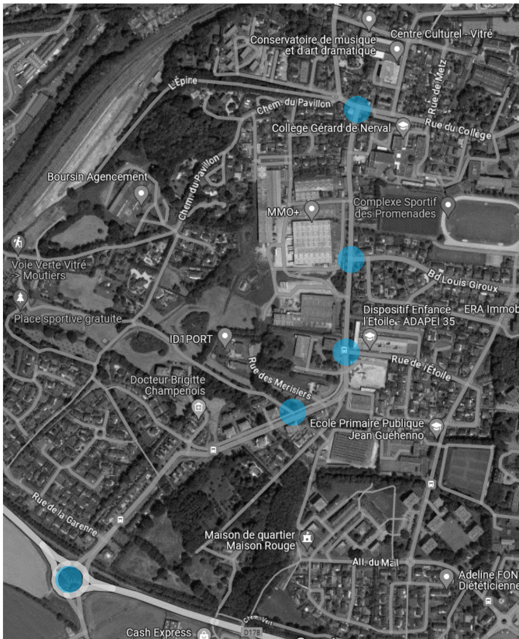
Localisation des carrefours enquêtés

Les carrefours faisant l'objet de comptages directionnels sont indiqués sur le schéma ci-dessous.